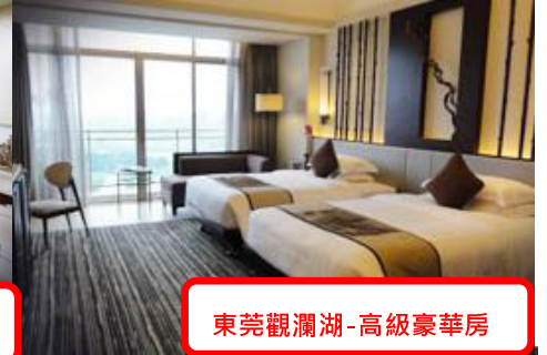
東莞觀瀾湖-高級豪華房