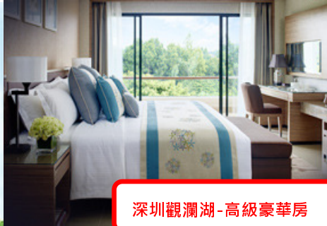
深圳觀瀾湖-高級豪華房